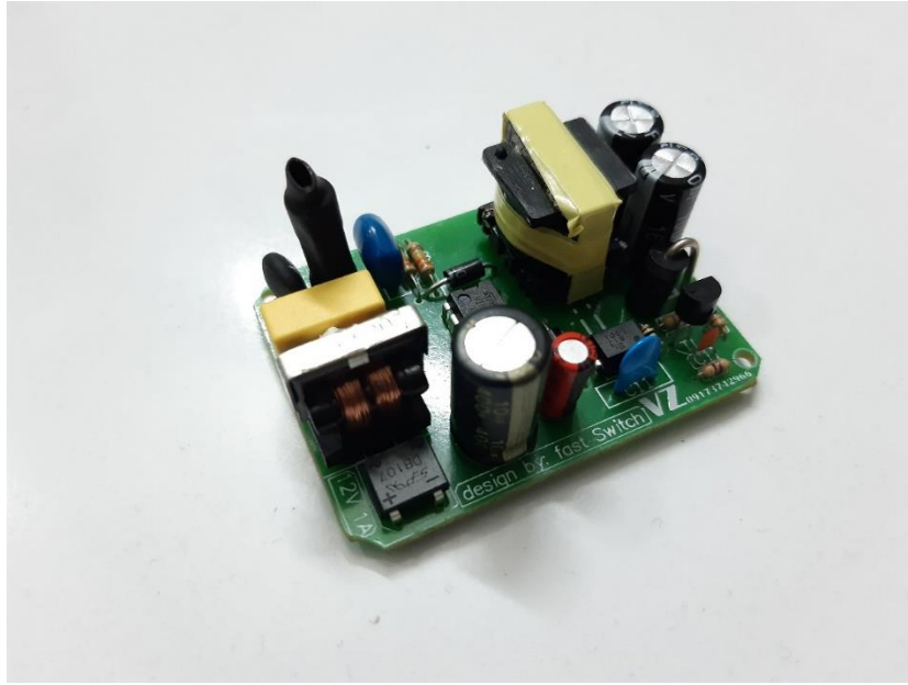
شکل 2: نمای کلی آداپتور