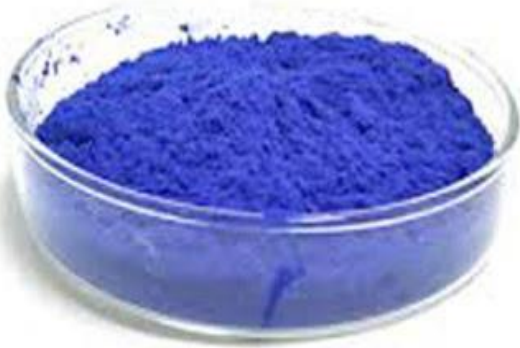
پودر خوراکی فیکوسیانین