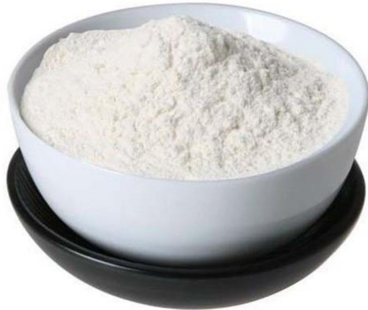
پودر سدیم آلزینات