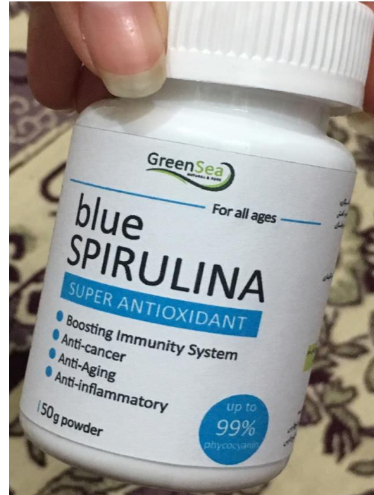
مکمل فیکوسیانین پلاس